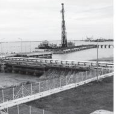
ဆိပ်ခံဆိပ်ခံတံတားကို တွေ့ရစဉ်။ ရွက်မည်ဖြစ်ကြောင်း၊ ယင်းအတွက် ကုန်ပစ္စည်းအမျိုးအစားများရှုပ်ထွေးမှုမရှိစေဘဲ ကုန်တင်ကုန်ချနှင့် ကုန်သွယ်ရေးများလုပ်ဆောင်ရာတွင် လွန်မြန်လွယ်ကူစေမည်ဖြစ်ကြောင်း သိရသည်။ လက်ရှိသီလဝါဆိပ်ကမ်းအတွင်း တည်ဆောက်ဆဲ၊ တည်ဆောက်ပြီးစီးသော ဆိပ်ခံတံတားအားလုံးကိုလည်း ဂျပန်နည်းပညာဖြင့် တည်ဆောက်ခြင်းဖြစ်ပြီး တည်ဆောက်ရန် လျာထားသည့် ဆိပ်ခံတံတား ၃၇ ခုအား ၂၀၂၀ ပြည့်နှစ်အတွင်း အပြီးတည်ဆောက်နိုင်မည်ဟု မျှော်မှန်းထားကြောင်း သိရသည်။ ယင်းအတွက် သီလဝါဆိပ်ကမ်း၌ တန်ခိုးနှစ်သောင်းတင်ဆောင်နိုင်သည့် ကုန်သေတ္တာတင်သင်္ဘောကြီးများ ဆိုက်ကပ်နိုင်မည့် ဆိပ်ခံတံတားလေးခုကိုလည်း ၂၀၁၈ ခုနှစ်အတွင်း အပြီးတည်ဆောက်မည်ဖြစ်ကြောင်း သိရသည်။ နီနီ

ရန်ကုန် ၈ ဇူလိုင် ၁၅ ရန်ကုန်မြို့၌ ထပ်မံတည်ဆောက်မည့် ဆိပ်ကမ်းနှင့် ဆိပ်ခံတံတားများတွင် ကုန်အမျိုးအစားသီးသန့်ခွဲခြားထားမည့်ပုံစံများ ပါဝင်မည်ဖြစ်ကြောင်း မြန်မာ့ဆိပ်ကမ်းအာဏာပိုင်အဖွဲ့ တာဝန်ရှိသူတစ်ဦးထံမှ သိရသည်။ အဆိုပါဆိပ်ကမ်းနှင့် ဆိပ်ခံတံတားများအား မြန်မာ့ဆိပ်ကမ်းအာဏာပိုင်အဖွဲ့နှင့် ပြည်တွင်း ပြည်ပကုမ္ပဏီများ ပူးပေါင်းဆောင်ရွက်မည်ဖြစ်ပြီး ထပ်မံတည်ဆောက်မည့် ဆိပ်ခံတံတား ၃၇ ခုအထိ လျာထားကြောင်း သိရသည်။ လက်ရှိတွင် ဆိပ်ခံတံတားပေါင်း ၁၀ ခုအထိ တည်ဆောက်ပြီးစီးခဲ့ပြီး တာဝန်ချထားပေးမှုတွင် ဆိပ်ခံတံတားပေါ်မူတည်၍ ခွဲဝေချထားပေးမည်ဖြစ်သည်။ ကုန်သေတ္တာအတွက်အချဆိပ်ကမ်းသည် ကုန်သေတ္တာအတွက်သာ သီးသန့်လုပ်ဆောင်မည်ဖြစ်ပြီး ဆီအတွက်အချလုပ်ဆောင်မည်မဟုတ်မည် ဆီအတွက်သာ သီးသန့်ဆောင်