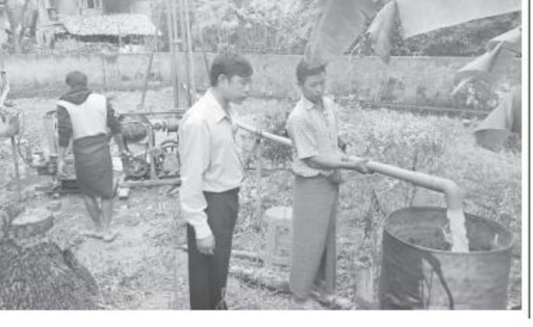
စက်ရေ(ကျောက်တံခါး)

ရှိသည့်အခြေအနေများကို ကြည့်ရှုကာ လိုအပ်သည်များ ကူညီပံ့ပိုးဆောင်ရွက် ပေးသည်။ အဆိုပါစက်ရေတွင်းမှာ အဝအကျယ် လေးလက်မ PVC တွင်းတိမ်အနက်ပေ ၂၀၀ ဖြင့် တူးဖော်ဆောင်ရွက်နေပြီး ယခုအခါ တစ်နာရီလျှင် ရေဂါလန် ၁၆၀၀ နှုန်း ရေသန့် များထွက်ရှိသည်။ စက်ရေတွင်းတူးဖော်ပြီးစီး သွားပါက အိမ်ခြေပေါင်း ၁၆၄ အိမ် အိမ်ထောင်စု ၁၆၈ စုတို့အတွက် များစွာ အကျိုးပြုနိုင်မည်ဖြစ်ကြောင်း သိရ သည်။