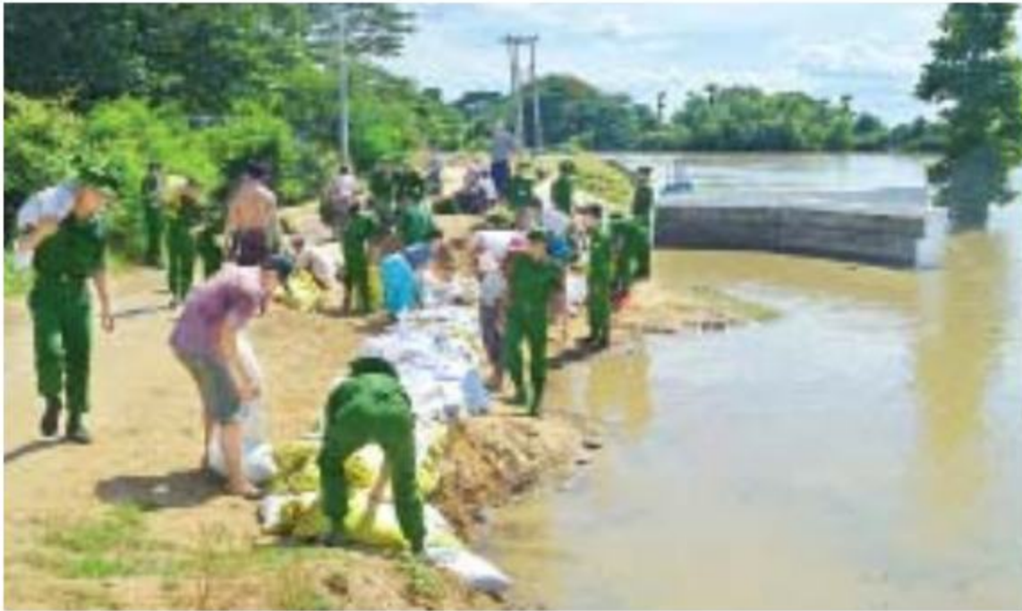
တပ်မတော်သားများနှင့် ဒေသခံပြည်သူများပူးပေါင်း၍ သဲအိတ်ချခြင်းလုပ်ငန်းများ ဆောင်ရွက်ပေးစဉ်။

နေပြည်တော် ၈ ဇူလိုင် ၁၅ စစ်ကိုင်းတိုင်းဒေသကြီးအတွင်း မိုးအဆက်မပြတ်ရွာသွန်း၍ ချင်းတွင်းမြစ်ရေမြင့်တက်ပြီး မုံရွာမြို့နယ်နှင့်ချောင်းဦးမြို့နယ်တို့ရှိ ကျေးရွာများသို့ ရေများဝင်ရောက်မှုများကြောင့် မုံရွာမြို့နယ်၊ ညောင်ဖြူပင်ကျေးရွာ၊ ဆန်းတောကြီးရေထိန်းတံတားအနီး တာပေါင်မိုးနှင့် ချောင်းဦးမြို့နယ်၊ ရွှေဒါးကျကျေးရွာ ရေထိန်းတံတားတစ်ခုတည်းရေစိမ့်ထွက်မှုများဖြစ်ပေါ်ခဲ့ရာ ဇူလိုင် ၁၄ ရက် နေ့လယ်ပိုင်းတွင် အနောက်မြောက်တိုင်းစစ်ဌာနချုပ်၊ မုံရွာတပ်နယ်မှ တပ်မတော်သားများက ဒေသခံပြည်သူများနှင့်ပူးပေါင်း၍ တာပေါင်မိုးခြင်း၊ သဲအိတ်ချခြင်းများဆောင်ရွက်ပေးသည်။ အလားတူ ရောဂါတိုက်ရန်နှင့်ချင်းတွင်းမြစ်ရေမြင့်တက်လာမှုကြောင့် ပခုက္ကူမြို့၊ အမှတ်(၁၃)ရပ်ကွက်အတွင်း ရေဝင်ရောက်နိုင်သောရေမြောင်းများအား ပခုက္ကူတပ်နယ်မှတပ်မတော်သားများက မီးသတ်တပ်ဖွဲ့ဝင်များ၊ ဒေသခံပြည်သူများနှင့်ပူးပေါင်း၍ သဲအိတ်များချခြင်းနှင့် စာမျက်နှာ ၁၃ ကော်လံ ၁ ငါ