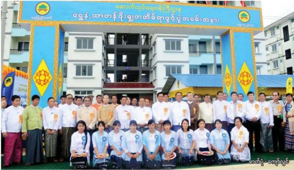
ဒုတိယသမ္မတ ဦးဟင်နရီဗန်ထီးယူ ရွှေနံ့သာတန်ဖိုးမျှတအိမ်ရာဖွင့်ပွဲအခမ်းအနားသို့ တက်ရောက်လာကြသူများနှင့်အတူ စုပေါင်းဓာတ်ပုံရိုက်စဉ်။

ထို့နောက် ဒုတိယသမ္မတ ဦးဟင်နရီ ဗန်ထီးယူက ရွှေနံ့သာတန်ဖိုးမျှတအိမ်ရာ ဖွင့်ပွဲအထိမ်းအမှတ် ကမ္ပည်းမော်ကွန်းကို စက်ခလုတ်နှိပ်ဖွင့်လှစ်ပေးပြီး အရွှေနံ့သာရည် များ ပက်ဖျန်းပေးသည်။