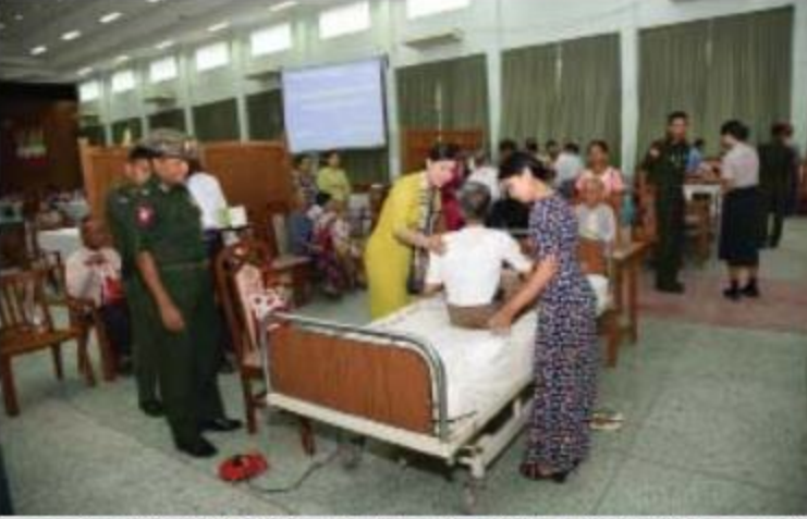
ကာကွယ်ရေးဦးစီးချုပ်ရုံး(ကြည်း)၊ စခန်းမှူးရုံး၊ စခန်းမှူး ဗိုလ်မှူးချုပ်သက်ထွန်းဦး ဇေယျာသီရိ ဗြူနယ်ရှိ နယ်မြေခံတပ်မတော်ဆေးရုံကြီးမှ ဆေးကုသရေးအဖွဲ့က အဘိုး၊ အဘွားများအား ကျန်းမာရေးစောင့်ရှောက်မှုလုပ်ငန်းများဆောင်ရွက်ပေးနေမှုကို ကြည့်ရှုအားပေးစဉ်။

နေပြည်တော် ၇လိုင် ၁၅ ကာကွယ်ရေးဦးစီးချုပ်ရုံး(ကြည်း)ဝင်း အတွင်းရှိ အသက် ၇၀ နှစ်အထက် မှီခိုသူ အဘိုး၊ အဘွား ၈၉ ဦးအား ယနေ့နံနက်ပိုင်း တွင် နေပြည်တော်၊ ဇေယျာသီရိဗြူနယ်ရှိ နယ်မြေခံတပ်မတော်ဆေးရုံကြီးမှ ဆေးကုသ ရေးအဖွဲ့က နဝဒေးခန်းမ၌ လိုအပ်သည့် ကျန်းမာရေးစောင့်ရှောက်မှုလုပ်ငန်းများနှင့် အာဟာရကျွေးမွေးခြင်းများ ဆောင်ရွက်ပေး သည်။ ထိုသို့ ဆောင်ရွက်ပေးနေမှုများကို ကာ ကွယ်ရေးဦးစီးချုပ်ရုံး(ကြည်း)၊ စခန်းမှူးရုံး၊ စခန်းမှူး ဗိုလ်မှူးချုပ်သက်ထွန်းဦးနှင့်အဖွဲ့ဝင် များက သွားရောက်ကြည့်ရှု၍ လိုအပ်သည် များ ညှိနှိုင်းဆောင်ရွက်ပေးခဲ့ကြောင်း သတင်း ရရှိသည်။ (၁၀၀)