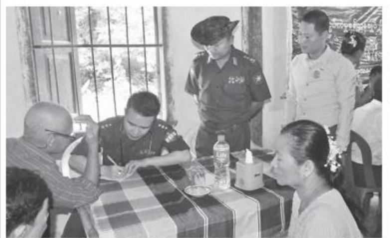
တောင်ပိုင်းတိုင်းစစ်ဌာနချုပ် နယ်လှည့်ဆေးကုသရေးအဖွဲ့က ဒေသခံပြည်သူများအား ကျန်းမာရေးစောင့်ရှောက်မှုလုပ်ငန်းများ ဆောင်ရွက်ပေးစဉ်။