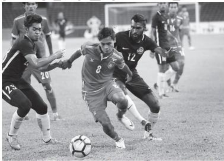
ရန်ကုန်မြို့သို့ ပြန်လည်ရောက်ရှိလာပြီး ယင်းနေ့ညနေပိုင်းမှာပင် သုဝဏ္ဏလှေကျင့်

မြန်မာ ယူ-၂၂ အသင်းသည် မလေးရှားနှင့် ခြေစစ်ပွဲအပြီးတွင် ယမန်နေ့က