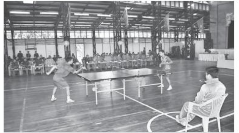
ကမ်းရိုးတန်းဒေသတိုင်းစစ်ဌာနချုပ်၏ ၂၀၁၇ ခုနှစ် တိုင်းမှူးခိုင်းစားပွဲတင်တင်းနစ်ပြိုင်ပွဲ ဗိုလ်လုပွဲလှည့်ပြိုင်တစ်စဉ်။

နေပြည်တော် ၇ ဇူလိုင် ၁၅ ကမ်းရိုးတန်းဒေသတိုင်းစစ်ဌာနချုပ်၏ ၂၀၁၇ ခုနှစ်၊ တိုင်းမှူးခိုင်းစားပွဲတင်တင်းနစ်ပြိုင်ပွဲ ဗိုလ်လုပွဲနှင့်ဆုပေးပွဲကို ယနေ့နေ့လယ်ပိုင်းတွင် တိုင်းစစ်ဌာနချုပ်၊ တိုင်းရန်အောင်ခန်းမ၌ ပြုလုပ်ရာ တိုင်းမှူး ဗိုလ်မှူးချုပ်လင်းအောင်နှင့် အရာရှိ၊ စစ်သည်၊ မိသားစုများ၊ ဗိုလ်အဖွဲ့ဝင်များ၊ ပြိုင်ပွဲဝင်အသင်းများနှင့် အားကစားဝါသနာရှင်များ တက်ရောက်ကြသည်။ ဦးစွာ တိုင်းမှူးနှင့် တက်ရောက်လာကြသူများက ဗိုလ်လုပွဲ ပွဲစဉ်ဖြစ်သည့် ကမ်းရိုးတန်းဒေသတိုင်းစစ်ဌာနချုပ်၊ စခန်း(က)