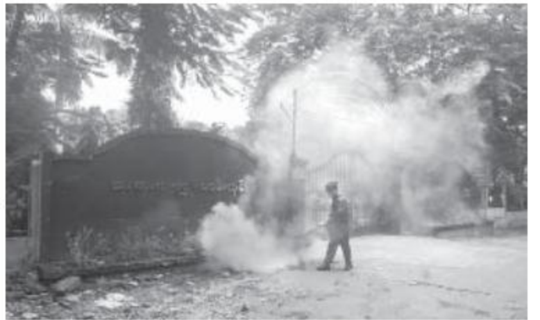
ရန်ကုန်တိုင်းစစ်ဌာနချုပ် ရန်ကုန်တပ်နယ်မှ တပ်မတော်သားများက ခြင်္သေ့အောင်းနှင့်သောနေရာများကို ခြင်္သေ့ဖျန်းခြင်းများ ဆောင်ရွက်ပေးစဉ်။

နေပြည်တော် ၇ ဇူလိုင် ၁၅ ရန်ကုန်တိုင်းဒေသကြီး၊ မရမ်းကုန်းမြို့နယ်ရှိ အမှတ်(၅)အခြေခံပညာအထက်တန်းကျောင်းနှင့် မှော်ဘီမြို့နယ်၊ အမှတ်(၁)ရပ်ကွက်ရှိ ပြည်သူ့ဆေးရုံတို့၏ ပတ်ဝန်းကျင်သန့်ရှင်းသာယာလှပရေးအတွက် အမှတ်(၅)ကျောင်းလင်းခြင်း၊ ချွံနွယ်ပေါင်းမြက်များ ခုတ်ထွင်ရှင်းလင်းခြင်း၊ ရေစီးရေလာကောင်းမွန်စေရေးအတွက် မြေတွင်းစက်များဖြင့် ရေမြောင်းများ ပြန်လည်ဖော်ခြင်းနှင့် ခြင်္သေ့အောင်းများကို ယနေ့နံနက်ပိုင်းတွင် ရန်ကုန်တိုင်းစစ်ဌာနချုပ်၊ ရန်ကုန်တပ်နယ်မှ တပ်မတော်သားများက စုပေါင်းဆောင်ရွက်ပေးခဲ့ကြောင်း သတင်းရရှိသည်။ (၁၀၀)