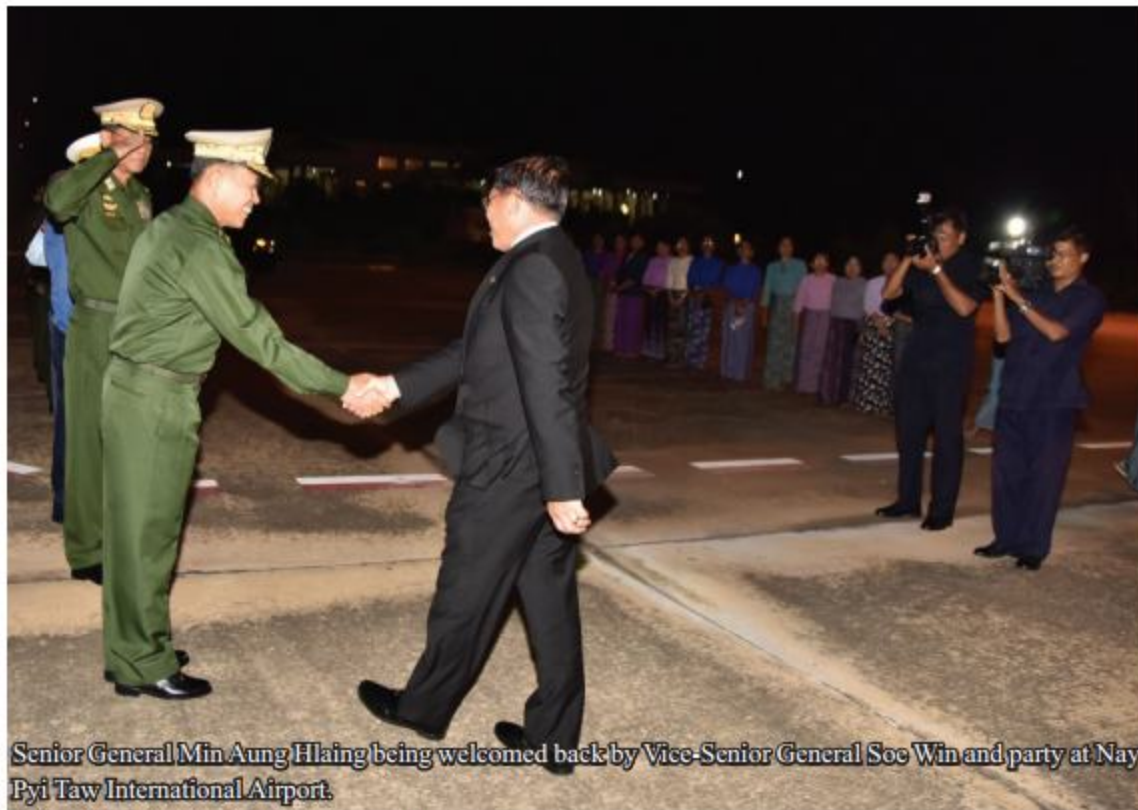
Senior General Min Aung Hlaing being welcomed back by Vice-Senior General Soe Win and party at Nay Pyi Taw International Airport.