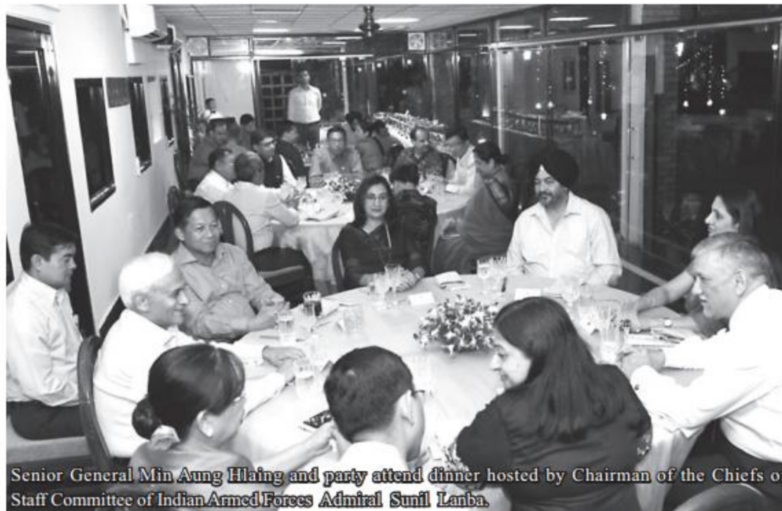
Senior General Min Aung Hlaing and party attend dinner hosted by Chairman of the Chiefs of Staff Committee of Indian Armed Forces Admiral Sunil Lanba.