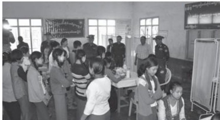
အရှေ့မြောက်တိုင်းစစ်ဌာနချုပ် တိုင်းမှူး ဗိုလ်မှူးချုပ်ခင်လှိုင် နယ်လှည့်ဆေးကုသရေးအဖွဲ့က ကျောင်းသား၊ ကျောင်းသူများအား ကျန်းမာရေးစောင့်ရှောက်မှုလုပ်ငန်းများ ဆောင်ရွက်ပေးနေစဉ်။

နေပြည်တော် ၇ ဇူလိုင် ၁၅ ရှမ်းပြည်နယ်(မြောက်ပိုင်း)၊ သီပေါမြို့နယ်၊ မန်လီကျေးရွာအခြေခံပညာအထက်တန်းကျောင်းခွဲမှ ဆရာ၊ ဆရာမများ၊ ကျောင်းသား၊ ကျောင်းသူများနှင့် ကျေးရွာဒေသခံပြည်သူများအား ၇ ဇူလိုင် ၁၄ ရက် နံနက်ပိုင်းတွင် အရှေ့မြောက်တိုင်းစစ်ဌာနချုပ် နယ်လှည့်ဆေးကုသရေးအဖွဲ့က အဆိုပါကျောင်းကျန်းမာရေးစောင့်ရှောက်မှုလုပ်ငန်းများနှင့် ကျန်းမာရေးအသိပညာပေးဟောပြောခြင်းများ ဆောင်ရွက်ပေးသည်။ ဦးစွာ နယ်လှည့်ဆေးကုသရေးအဖွဲ့က ဝမ်းပျက်ဝမ်းလျှောရောဂါ၊ သွေးလွန်တုပ်ကွေးရောဂါနှင့် မူးယစ်ဆေးဝါးအန္တရာယ်တားဆီးရေးဆိုင်ရာ သိကောင်းစရာများကို ကျန်းမာရေးအသိပညာပေးဟောပြောဆွေးနွေးခြင်းများပြုလုပ်ပေးသည်။ ထို့နောက် ကျောင်းသား၊ ကျောင်းသူ ၂၇၇ ဦးတို့ကို အရပ်တိုင်းခြင်း၊ ပေါင်ချိန်ခြင်း၊ သွေးအုပ်စုခွဲခြင်းများဆောင်ရွက်ပေးပြီး ဆရာ၊ ဆရာမ ၁၅ ဦး၊ ကျောင်းသား၊ ကျောင်းသူများနှင့် ဒေသခံပြည်သူ ၁၅၀ ဦးတို့ကို သွားနှင့်ခံတွင်းရောဂါ၊ မျက်စိရောဂါ၊ နား/နှာခေါင်း/လည်ချောင်းရောဂါ၊ အထွေထွေရောဂါတို့နှင့်ပတ်သက်၍ လိုအပ်သည့်ဆေးဝါးကုသပေးခြင်း