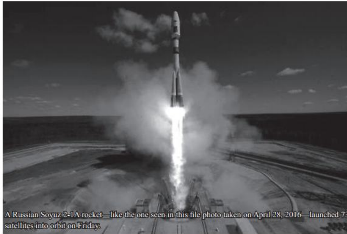
A Russian Soyuz 2-1A rocket—like the one seen in this file photo taken on April 28, 2016—launched 73 satellites into orbit on Friday.

The primary payload, the Kanopus-V-IK satellite, is to provide