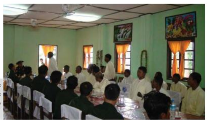
အရှေ့အလယ်ပိုင်းတိုင်းစစ်ဌာနချုပ် တိုင်းမှူး ဗိုလ်ချုပ်သန်းလွင် စစ်မှုထမ်းဟောင်းအဖွဲ့ဝင်များနှင့် ပြည်သူ့စစ်(ဌာနေ)အဖွဲ့ဝင်များအား တွေ့ဆုံစဉ်။