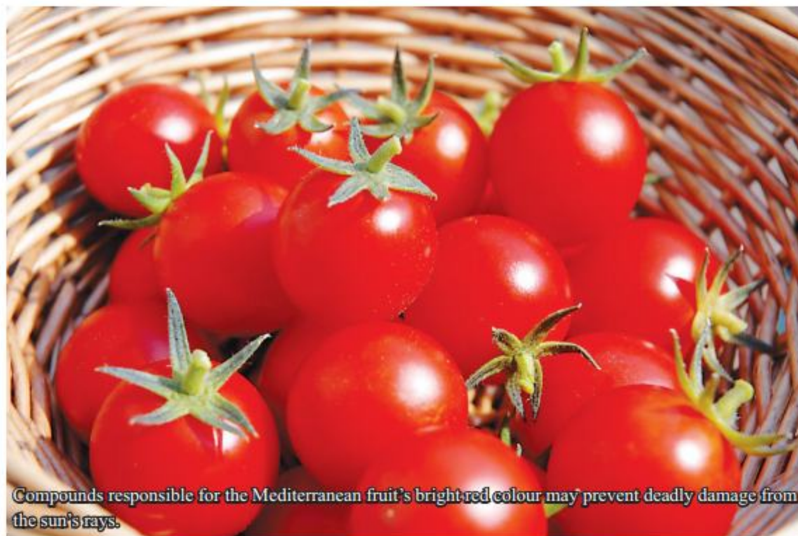
Compounds responsible for the Mediterranean fruit's bright red colour may prevent deadly damage from the sun's rays.

The researchers said male mice develop tumours earlier after UV exposure and that their tumours are