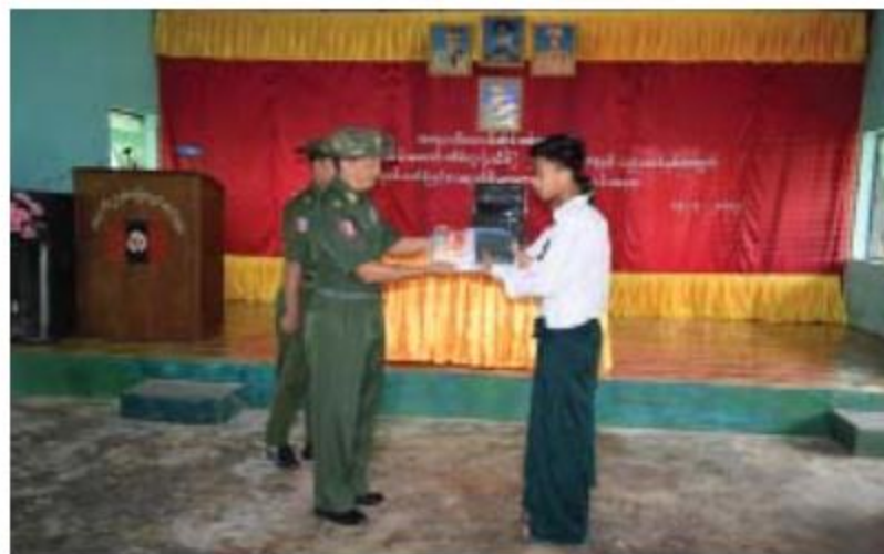
အနောက်တောင်တိုင်းစစ်ဌာနချုပ် တိုင်းမှူး ဗိုလ်ချုပ်တေဇကျော် ကျောင်းသား၊ ကျောင်းသူများအတွက် ကျောင်းဝတ်စုံနှင့် စာရေးကိရိယာများပေးအပ်စဉ်။

နေပြည်တော် ၇လိုင် ၁၅ ရောဝတီတိုင်းဒေသကြီး၊ ပုသိမ်မြို့၊ ရွှေဝတ်မှုန်စစ်မှုထမ်းဟောင်းအိမ်ရာနေ စစ်မှုထမ်းဟောင်းအဖွဲ့ဝင်များ၏ မိသားစုဝင်ကျောင်းသား၊ ကျောင်းသူများအား ကျောင်းဝတ်စုံနှင့် စာရေးကိရိယာပေးအပ်ခြင်းကို ယနေ့နံနက်ပိုင်းတွင် ပုသိမ်မြို့ရှိ နယ်မြေခံတပ်ရင်းခန်းမ၌ပြုလုပ်ရာ အနောက်တောင်တိုင်းစစ်ဌာနချုပ် တိုင်းမှူး ဗိုလ်ချုပ်တေဇကျော်နှင့်အဖွဲ့ဝင်များ၊ စစ်မှုထမ်းဟောင်းအဖွဲ့ဝင်များနှင့် မိသားစုဝင်များ၊ ကျောင်းသား၊ ကျောင်းသူများ တက်ရောက်ကြသည်။