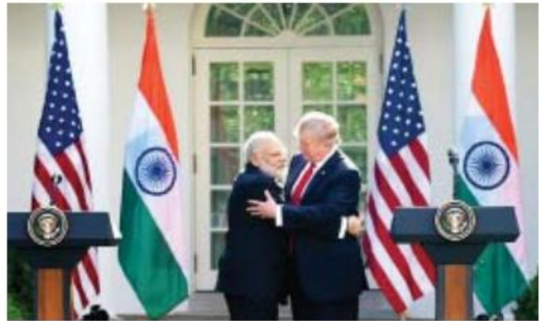
ပြီးနောက်ပိုင်းတွင် ကာကွယ်ရေးဝန်ကြီးနှင့် နိုင်ငံခြားရေးဝန်ကြီးတို့အနေဖြင့် ရက်ပေါင်း ၁၈၀ အတွင်း အမေရိကန်ပြည်ထောင်စုနှင့် အိန္ဒိယနိုင်ငံတို့အကြား စစ်ဘက်ဆက်ဆံရေးကိုမြှင့်တင်မည့်မဟာဗျူဟာတစ်ရပ်ချမှတ်ရမည်ဖြစ်ကြောင်း သိရသည်။ Ref: PTI

များ၊ သိပ္ပံနှင့်နည်းပညာဆိုင်ရာပူးပေါင်းဆောင်ရွက်မှုကိုသို့သော နယ်ပယ်များတွင်လည်း အကျိုးဝင်မည်ဖြစ်ကြောင်း သိရသည်။ သို့ရာတွင် NDAA-2018 မူကြမ်းကို အထက်လွှတ်တော်သို့တင်သွင်း၍ အတည်ပြုချက်ရယူရန်လိုအပ်နေသေးပြီး အထက်လွှတ်တော်ကအတည်ပြုပြီးမှသာ သမ္မတက ဥပဒေအဖြစ် လက်မှတ်ရေးထိုးမည်ဖြစ်သည်။ ယင်းမူကြမ်းကို နိုင်ငံတော်ကာကွယ်ရေးဆိုင်ရာခွင့်ပြုမိန့်အဖြစ် ဥပဒေပြဋ္ဌာန်း