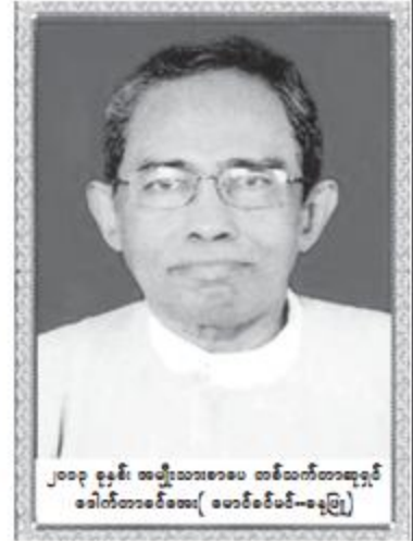
၂၀၁၃ ခုနှစ် အမျိုးသားစာပေ တစ်ဆက်တည်းဆုရှင် ဒေါက်တာစောဝေ( မေပီဒီစီ-၁၉၆၅)

“အင်း . . . မြန်မာစာအုပ်ကြီးကို ကတ်သီးကတ်သတ် မေးသလိုများဖြစ်နေ မလားမသိဘူး။ မေးစရာတစ်ခုပေါ်လာ လို့ကွ” “ဘာမေးမလို့လဲ။ အမိန့်ရှိစမ်းပါဦးဗျာ။ ကျွန်တော်မြေခိုင်ရင်လည်း မြေရမှာပေါ့” အိမ်ကိုအလည်ရောက်လာသော သူငယ် ချင်းက စကားစသည့်အတွက် ကျွန်တော်က ခပ်သောသောကလေး ပြောလိုက်သည်။ “ဪ . . . ခုပဲ ပြက္ခဒိန်ကြည့်နေရင်း မေးစရာပေါ်လာတာပါ။ နေ့နာမည်တွေမှာ “တနင်္ဂနွေ၊ တနင်္လာ၊ အင်္ဂါ”ဆိုတဲ့နေ့နာမည် တွေက စာလုံးအပေါ်မှာ ငသတ်သေးသေး ကလေးတွေတင်ပြီးရေးတာ ဘာကြောင့်လဲ လို့ သိချင်လို့ပါ သူငယ်ချင်းရာ။ အဲဒီလို အပေါ်မှာမတင်ဘဲ ဟောဒီလိုရေးရင်လို့