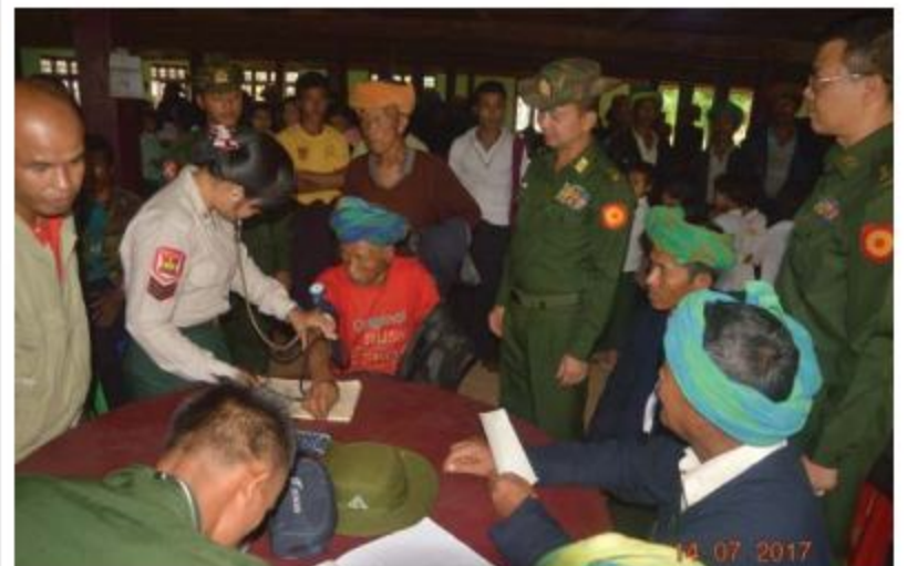
အရှေ့ပိုင်းတိုင်းစစ်ဌာနချုပ် တိုင်းမှူး ဗိုလ်ချုပ်ဝင်းမင်းထွန်း နယ်လှည့်ဆေးကုသရေးအဖွဲ့က ဒေသခံပြည်သူများအား ကျန်းမာရေးစောင့်ရှောက်မှုလုပ်ငန်းများဆောင်ရွက်ပေးနေမှုကို ကြည့်ရှုအားပေးစဉ်။

နေပြည်တော် ၇လိုင် ၁၅ ရှမ်းပြည်နယ်(တောင်ပိုင်း)၊ တောင်ကြီးမြို့နယ်၊ ဖက်ကွန်ကျေးရွာအုပ်စု၊ အံ့အားကျေးရွာနှင့် ပတ်ဝန်းကျင်ကျေးရွာများမှ ဒေသခံပြည်သူများအား ၇လိုင် ၁၄ ရက်နေ့လယ်ပိုင်းတွင် အရှေ့ပိုင်းတိုင်းစစ်ဌာနချုပ် နယ်လှည့်ဆေးကုသရေးအဖွဲ့က အဆိုပါကျေးရွာရှိ မင်းကွန်းသာသနာမာန်အောင်ကျောင်းတိုက်၌ ကျန်းမာရေးစောင့်ရှောက်မှုလုပ်ငန်းများ ဆောင်ရွက်ပေးသည်။