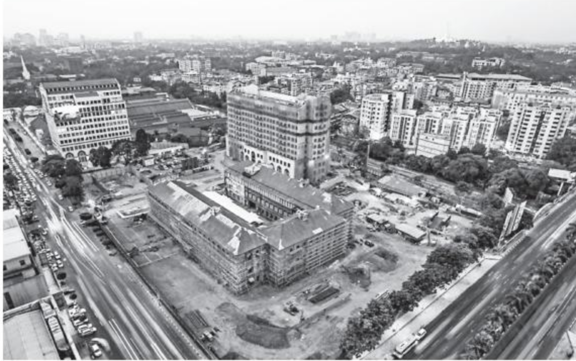
Yoma ဘဏ်က ၁၂ ရာခိုင်နှုန်း၊ Yoma Strategic Holding က ၄၈ ရာခိုင်နှုန်းဖြင့် ရင်းနှီးမြှုပ်နှံမှု ၆၀ ရာခိုင်နှုန်းရှိပြီး မစ်ဆူဘီရိုတော်ပိုရေးရှင်းက ၃၀ ရာခိုင်နှုန်း၊ The International Finance Corporation (IFC) က ၅ ရာခိုင်နှုန်းနှင့် အာရှဖွံ့ဖြိုးရေးဘဏ် (ADB) က ၅ ရာခိုင်နှုန်း ရင်းနှီးမြှုပ်နှံထားကြောင်း သိရသည်။ (၄၄၇)

ရန်ကုန် ၈ ဇူလိုင် ၁၅ ရန်ကုန်မြို့လယ်ရှိ တည်ဆောက်လျက်ရှိသည့် ရိုးမစင်ထရယ်စီမံကိန်း၏ တည်ဆောက်ရေးလုပ်ငန်းများ စတင်နေပြီဖြစ်ရာ ယင်းစီမံကိန်းကို လေးနှစ်ခန့်အချိန်ယူတည်ဆောက်ရမည်ဖြစ်ကြောင်း Yoma Strategic Holding ကုမ္ပဏီ တာဝန်ရှိသူတစ်ဦးထံမှ သိရသည်။ Yoma Strategic Holding ကုမ္ပဏီ အနေဖြင့် ရန်ကုန်မြို့ ဆူးလေဘုရားလမ်းနှင့် ဗိုလ်ချုပ်အောင်ဆန်းလမ်းထောင့်ရှိ သမိုင်းဝင်မီးရထားရုံအနီးရှိနေရာကို ရွေးချယ်ယူမြင်ဆင်၍ ဟိုတယ်လုပ်ငန်းအပါအဝင် လူနေအိမ်ခန်းနှင့် ရုံးခန်းများပါဝင်သော စီမံကိန်းကို စတင်တည်ဆောက်နေခြင်းဖြစ်သည်။ ရန်ကုန်မြို့လယ်ရှိ မြေ ၁၀ ဧကတွင် တည်ဆောက်လျက်ရှိသော ယင်းစီမံကိန်းတွင် Peninsular ဟိုတယ်အပါအဝင် ရုံးခန်းများပါဝင်သော တာဝါနှစ်လုံး၊ ဟိုတယ်တစ်လုံးနှင့် လူနေအိမ်ခန်းများပါဝင်သော Apartment များ ပါဝင်မည်ဖြစ်ကြောင်း သိရသည်။ အဆိုပါစီမံကိန်းတွင် မြန်မာနိုင်ငံဘဏ်မှ