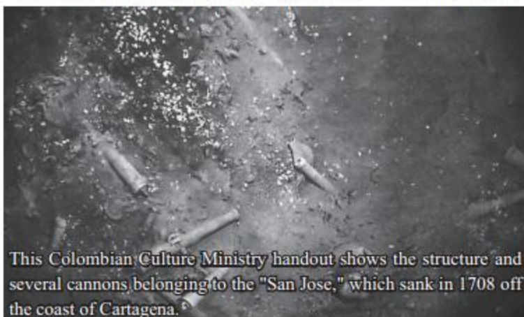
This Colombian Culture Ministry handout shows the structure and several cannons belonging to the "San Jose," which sank in 1708 off the coast of Cartagena.

The find however was not confirmed, and in 2011 a US court ruled that the wreck was Colombian property.