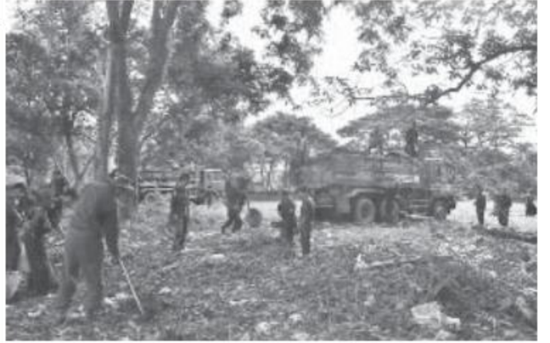
အလယ်ပိုင်းတိုင်းစစ်ဌာနချုပ် မန္တလေးတပ်နယ်မှ တပ်မတော်သားများက အမှိုက်များရှင်းလင်းပေးစဉ်။

နေပြည်တော် ၇ ဇူလိုင် ၁၅ မန္တလေးမြို့၊ ချမ်းအေးသာစံမြို့နယ်၊ တောင်စလင်းကျောင်းတိုက်နှင့် ရတနာပုံတက္ကသိုလ်တို့၌ ယနေ့နံနက်ပိုင်းတွင် အလယ်ပိုင်းတိုင်းစစ်ဌာနချုပ် မန္တလေးတပ်နယ်မှ တပ်မတော်သားများနှင့် တက္ကသိုလ်လေ့ကျင့်ရေးတပ်မှ တပ်ဖွဲ့ဝင် ကျောင်းသား၊ ကျောင်းသူများပူးပေါင်း၍ ကျောင်းတိုက်နှင့်တက္ကသိုလ်ဝင်း အတွင်း/အပြင်ရှိ ချွံနွယ်ပေါင်းမြက်များ ခုတ်ထွင်ရှင်းလင်းခြင်းနှင့် အမှိုက်များ ရှင်းလင်းခြင်းတို့ကို စုပေါင်းဆောင်ရွက်ပေးခဲ့ကြောင်း သတင်းရရှိသည်။ (၁၀၀)