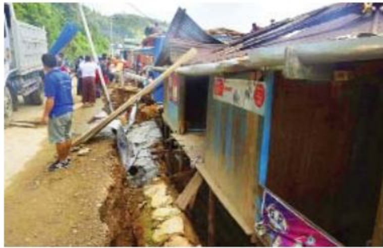
ဖလမ်းမြို့၊ တလန်လိုရပ်ကွက်တွင် မြေကျွဲကျမှုကို တွေ့ရစဉ်။

ဖလမ်း ၈ ဇူလိုင် ၁၅ ချင်းပြည်နယ် ဖလမ်းမြို့၊ တလန်လိုရပ်ကွက် ဗိုလ်ချုပ်လမ်းဘေးရှိ ခေါ်အိယန်းကွင်း ခေါ်တလွန်းသင်ဒီရပ်၊ ဦးနှုတ်နှင့် ဦးတွင်မူန်းတို့နေအိမ်များရှေ့မြေသားသည် မိုးအဆက်မပြတ်ရွာသွန်းခြင်းကြောင့် ဇူလိုင် ၁၄ ရက် ညနေပိုင်းကစ၍ တဖြည်းဖြည်းကျကျလျက်ရှိပြီး ယခုအခါ ၅ ပေခန့်ရောက်ရှိနေပြီဖြစ်သောကြောင့် ယနေ့ နံနက်ပိုင်းမှစ၍ နယ်မြေခံတပ်မတော်သားများ၊ မြန်မာနိုင်ငံရဲတပ်ဖွဲ့၊ မြန်မာနိုင်ငံမီးသတ်တပ်ဖွဲ့၊ သက်ဆိုင်ရာတာဝန်ရှိသူများနှင့် ဒေသခံပြည်သူများက အဆိုပါလူနေအိမ်များဖျက်သိမ်းခြင်းကို စိုင်းဝန်းကူညီဆောင်ရွက်ပေးကြကြောင်း သိရသည်။ “ကျွန်ုပ်တို့ရဲ့ နေအိမ်တွေ အခုလိုမြေသားကျကျပြီး ဖျက်လိုက်ရလို့ နေစရာအိမ်မရှိတော့တဲ့အတွက် နီးစပ်ရာ စာမျက်နှာ ၁၇ ကော်လံ ၃ >>