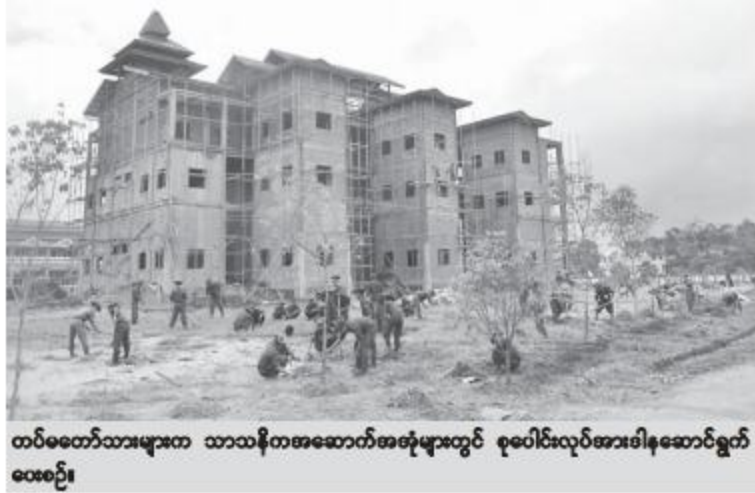
တပ်မတော်သားများက သာသနိကအဆောက်အအုံများတွင် စုပေါင်းလုပ်အားခါနီးဆောင်ရွက်ပေးစဉ်။

ဗိုလ်ချုပ်မြတ်ကျော်နှင့်အဖွဲ့ဝင်များက သွားရောက်ကြည့်ရှု၍လိုအပ်သည်များ ညှိနှိုင်းဆောင်ရွက်ပေးသည်။ အလားတူ ရေတာရှည်တပ်နယ်မှ တပ်မတော်သားများက ဆွာမြို့၊ ငါးကြီးကျွန်းဘုန်းတော်ကြီးကျောင်း၌ တည်ထားကိုးကွယ်လျက်ရှိသော မဟာပဌာန်းဗုဒ္ဓစေတီတော်မြတ်ကြီး၌လည်းကောင်း၊ ပဲခူးတပ်နယ်မှတပ်မတော်သားများက အခြေခံပညာအထက်တန်းကျောင်း(အင်းတော်)၌လည်းကောင်း၊ ပန်းတောင်းတပ်နယ်မှ တပ်မတော်သားများက ပန်းတောင်းမြို့နယ်၊ စွယ်တော်ကျေးရွာ ဘုန်းတော်ကြီးကျောင်း၌လည်းကောင်း၊ ပျဉ်ပုံကြီးတပ်နယ်မှ တပ်မတော်သားများက ဝမ်းဘဲအင်းကျေးရွာ တွဲဖက်အခြေခံပညာအထက်တန်းကျောင်း၌လည်းကောင်း၊ ညောင်လေးပင်တပ်နယ်မှ တပ်မတော်သားများက ကညွတ်ကွင်းမြို့ပြည်သူ့ဆေးရုံ၌လည်းကောင်း၊ ရွှေကျင်တပ်နယ်မှတပ်မတော်သားများက ရွှေကျင်မြို့ ပြည်သူ့ဆေးရုံ၌လည်းကောင်း စုပေါင်းလုပ်အားခါနီးဆောင်ရွက်ပေးခဲ့ကြောင်း သတင်းရရှိသည်။ (၁၀၀)