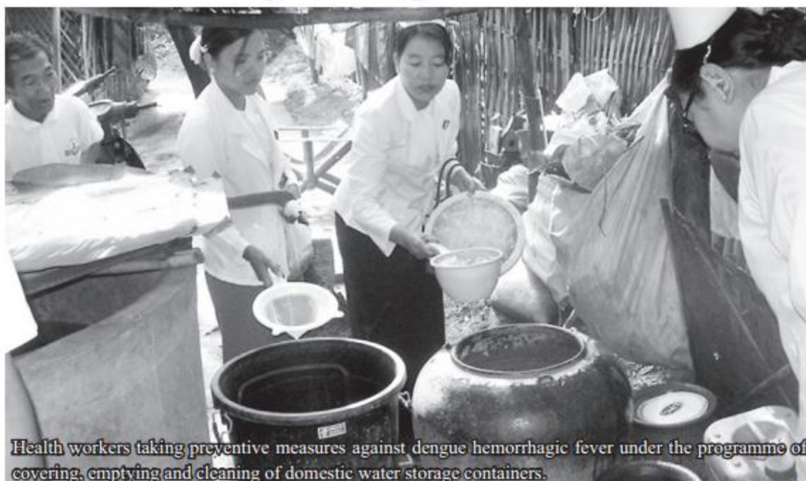
Health workers taking preventive measures against dengue hemorrhagic fever under the programme of covering, emptying and cleaning of domestic water storage containers.