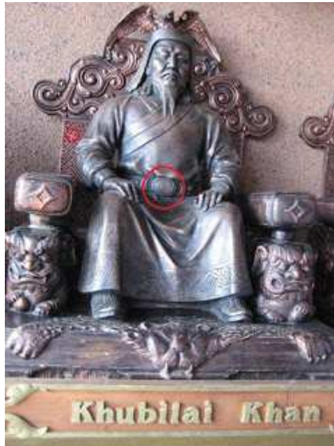
Türk Moğol Kağanı Kübilay Han