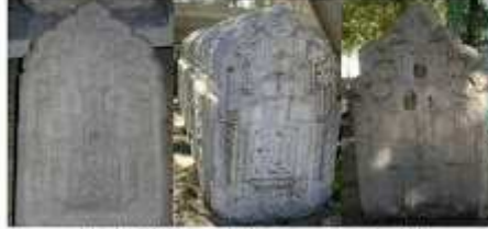
Fotoğraf 10. XIII-XIV. yy. mihrabına karşılık türbenin minare sütununda çarkaflek.