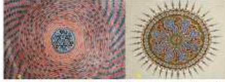
Fotoğraf 5. a-Fâti Mıratı Ulu Camii (1234) mihrabı köşelerindeki ahşaptenmiş çarın ve çarkaflek işlemi, b-Azraçlı II. Beyazıt Camii (1494) kubbesinde çarkaflek.