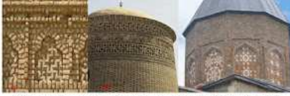
Fotoğraf 4. a- Hanekas-ı Kümbeti (1067-68), b-Piri-i Alendâr Kümbeti (1067-68), c-Sivas İ. İzzettin Keykavus Kümbeti (1219) Kümbetinde garırsı kaç motifleri.