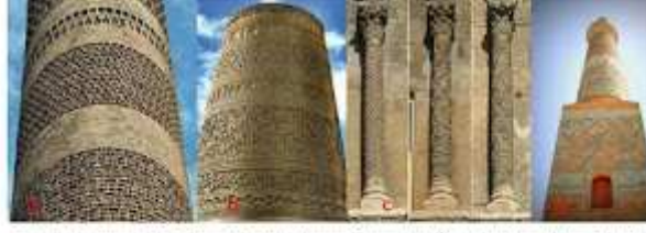
Fotoğraf 3. a-Burzura Kalan Minare (XI. yy), b-Damgan Minaresi (1058), c- Diyarbakır Ulu Camii (1092) doğu revaklarındaki sütunlar, d-Sütlü Ulu Camii (1129) Minaresi çarkaflek motifleri.