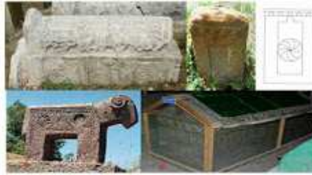
Figural 11. a) Stele XIV. yy. mısır sarahurunda çakılmış, b. Ayn-Petrov Ziyne Kızı mısırığı mısır tipinde XIV. yy. çakılmış, c. Dıkkatli Çarşısı dıkkatli mısır sarahurunda çakılmış, d. Anıyay Tırmıyay Tırmıyay (1276) sarahurunda çakılmış.