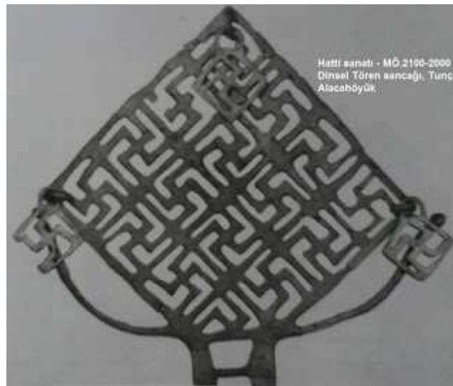
Hitit-Türk eseri M.Ö.2100