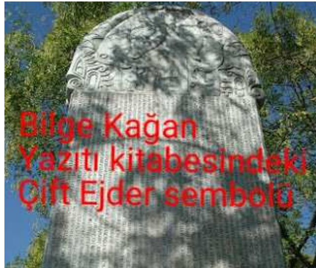
Bilge Kağan yazıtı Çift Ejder