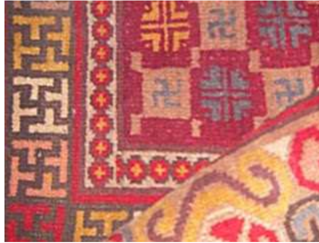
Anadolu Türk kilimi