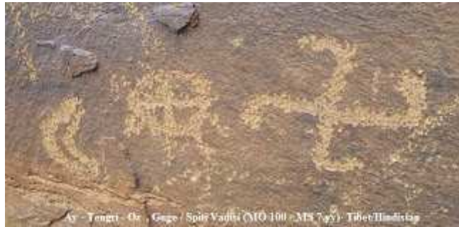
Kün-Ay Türk sembolü ve Gök-Çarkı