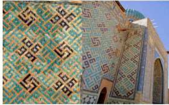
Fotoğraf 1. Hoca Ahmed Yesevi Külliyesi (1396)'nda garınlı haç (swastika) motifleri

Samarra kasesi olarak adlandırılan 6000 yıllık Sümer Türk kasesi:Kase üzerinde Gök-Çarkı tamgası var balıklar Türklerde Yurd anlamındadır. 8 balık Cennetin 8 yurdudur. Yakut Tanrı İnancında ise Ayın Tanarının bulunduğu yer (Tanrı katıdır) "Balık"Hun Türklerinde ülke yönetim merkezine/şehir devletine verilen addır. Asya Hun Devleti bu merkeze "Beşbalık" şehir devleti demiştir. Uygurlarsa "Hanbalık" Cengizhan tarafından Karakumda kurulan Cengiz Kağanlığının başkenti "Ordu-Balık"tır.