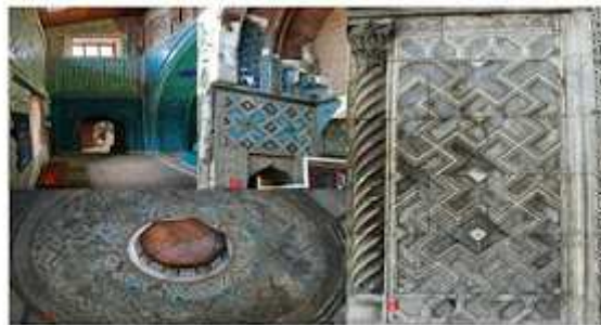
Fotoğraf 2. a. Konya Şahîş Ağa Hanı (1269-70)'nda, b. Konya Şahîş Medrese-eyvan girişinde, c. Konya İzzet Minareli Medrese kubbesinde, d. Konya Karatay Medresesi (1251) içkapısında garınlı haç motifleri.