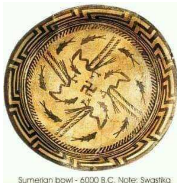
Sumerian bowl - 6000 B.C. Note: Swastika