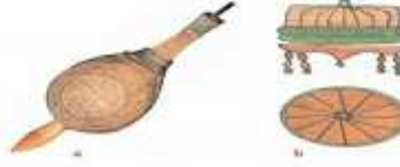
Fotoğraf 6 a-Konya Meriçli Minare XIV. yy. ahşaptirilen çarınlar üzerinde çarkaflek, b-Bektaşî türbesinde çarkaflek.