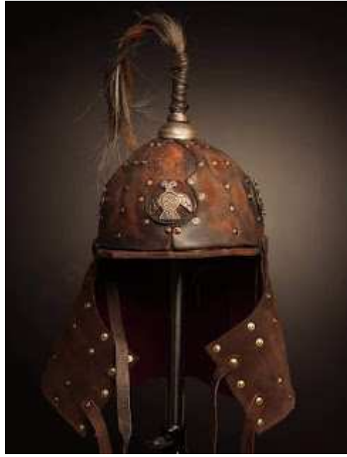
Altın Ordu Türk Savaşçı miğferi ve üzerindeki Gök-Çarkı tamgası