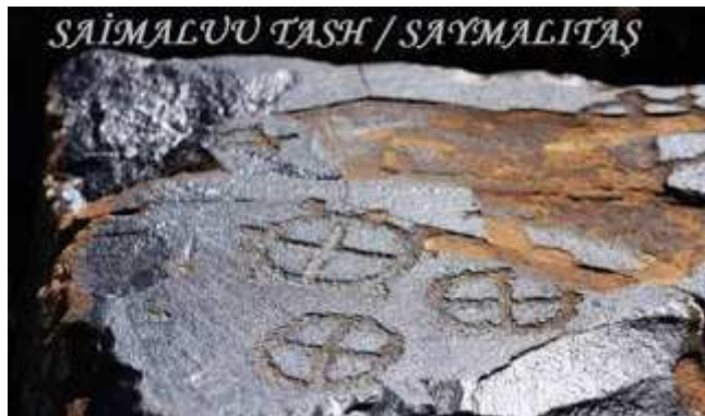
Saymalıtash kaya resmi Tengri tamgası