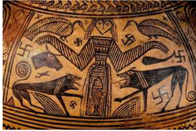
Etrüsk Türk eseri İki Gök-Börü Bozkurt ve Umay Ana