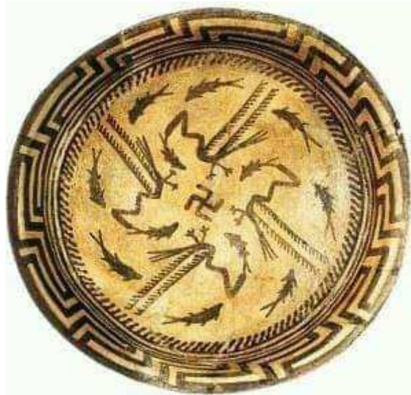
Sumerian bowl - 6000 B.C. Note: Swastika